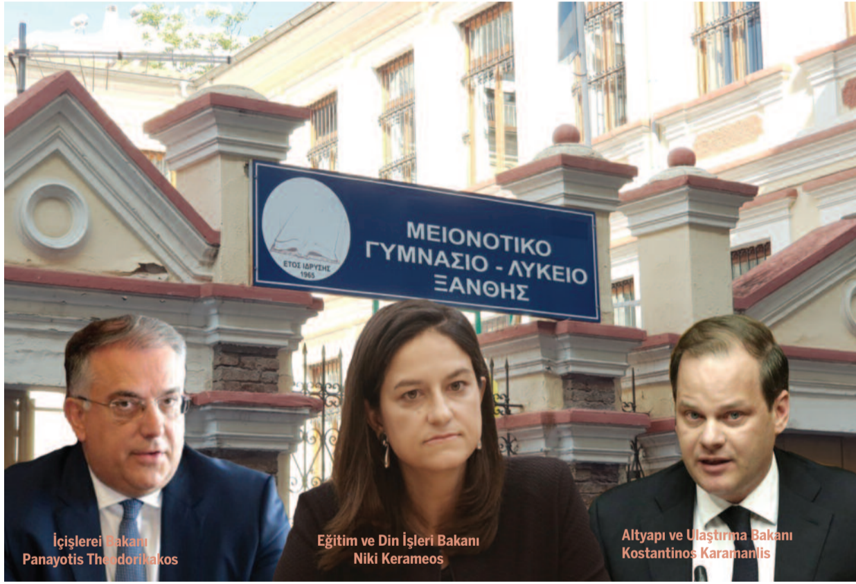
İçişleri Bakanı Panayotis Theodorakos

İskeçe Azınlık Ortaokulu – Lisesi'ndeki "vardiyalı eğitim" ve yeni bina sorununa çözüm beklentilerine henüz bir yanıt gelmedi.